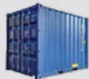
8' sandėliavimo konteineris (įrankinė) 2.438 x 2.200 x 2.260 mm (l x P x A)