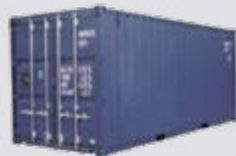
20' Sandėliavimo konteineris 6,058 x 2,438 x 2,591 mm (l x P x A)