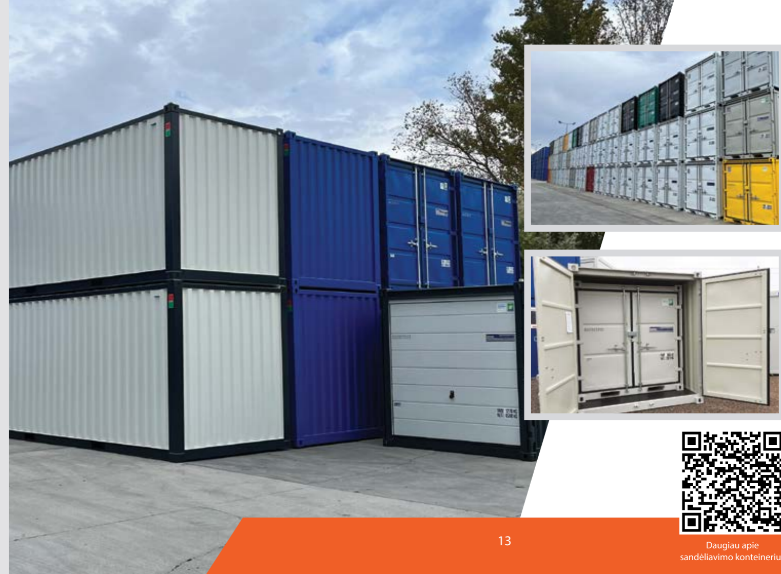
6' sandėliavimo konteineris (įrankinė) 1.980 x 1.970 x 1.910 mm (l x P x A)