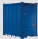
5' Moverbox 200 x 1,600 x 2,44 5 mm (l x P x A)